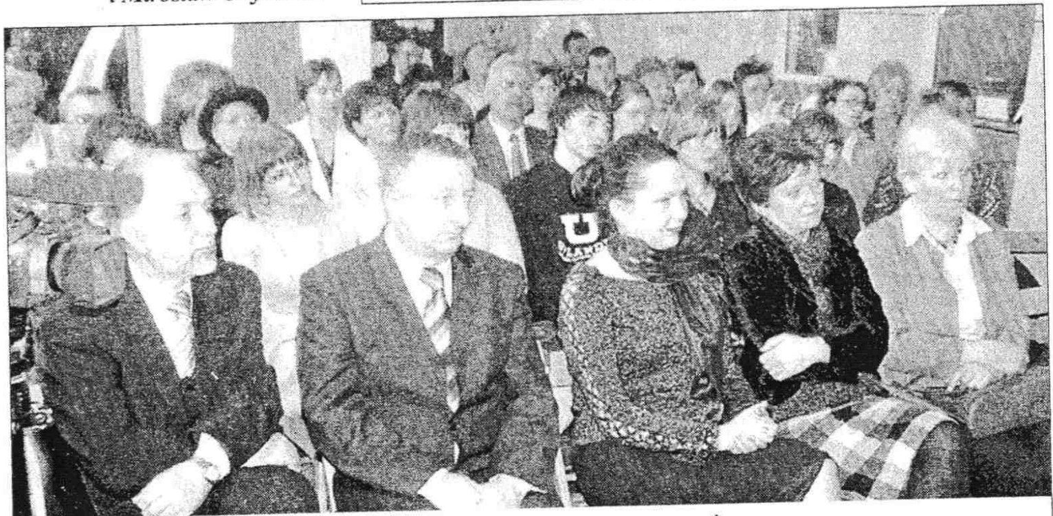
Wieczór cieszył się dużym zainteresowaniem