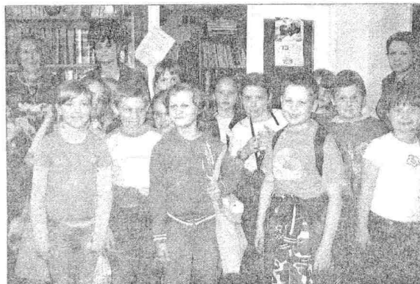
Wspólne zdjęcie z pisarką Wandą Chotomską