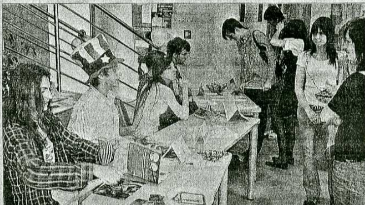
„Kąciki amerykańskie” przygotowane przez uczniów „Sobieskiego”