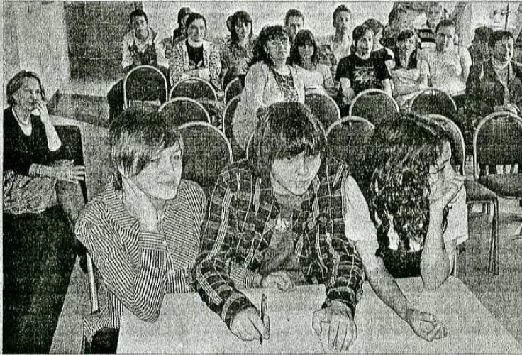
Gimnazjaliści podczas konkursu

W ostatni wtorek kwietnia, w Powiatowej i Miejskiej Bibliotece Publicznej w Wejherowie odbyła się impreza pod hasłem „Dzień Amerykański - American Day”. Współorganizował ją „Sobieski”.