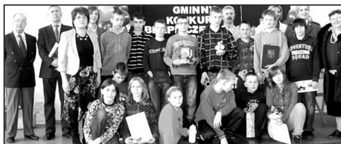
Wiedza, jaką przyswoili się uczestnicy z pewnością przyda się im w przyszłości.