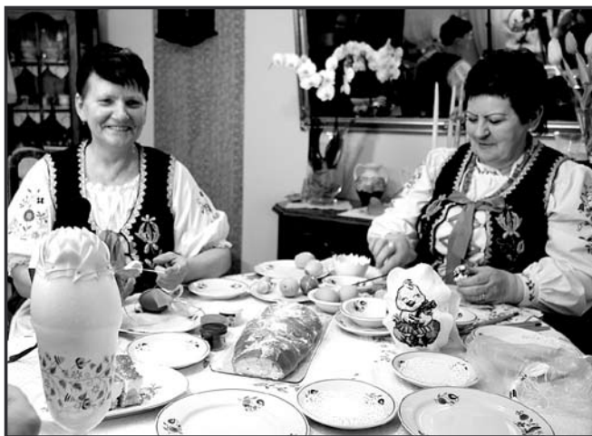
Panie z Koła Gospodyń Wiejskich z Kniewa podczas przygotowywania dekoracji świątecznych.

Jaja jako symbol życia były w tych dniach najważniejsze. Barwiono je w Wielką Sobotę rano, gotując w różnych roślinach: buraczkach, listkach młodego żyta, jemiole, łupinach cebuli czy w czerwonej kapuście. Takie jajka, rodzice chowali w niedzielę na podwórzu, aby dzieci mogły je potem szukać. Nie zanoszono wtedy święconki do kościoła.