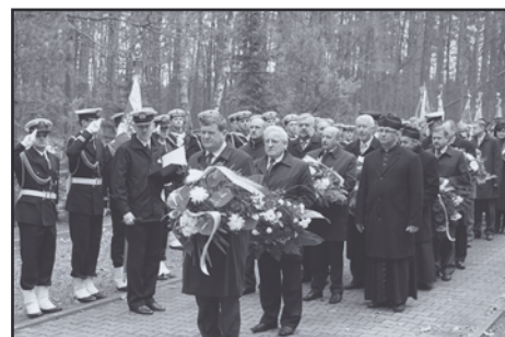
Więńce pod pomnikiem złożyli m.in.: posłowie na Sejm RP