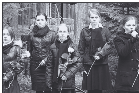
O Piaśnicy mówiła również młodzież z Samorządowego Gimnazjum w Bolszewie.