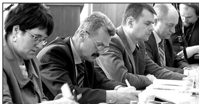
Większość uchwał przyjmowana była jednogłośnie

30 marca odbyła się VI sesja Rady Gminy Wejherowo. Podczas posiedzenia radni jednogłośnie przyjęli uchwały dotyczące zmian Miejscowych Planów Zagospodarowania Przestrzennego dla poszczególnych miejscowości, planu pracy Komisji Rewizyjnej oraz sprzedaży nieruchomości w Gościcinie. Sporo emocji wywołała dyskusja nad ustaleniem wysokości opłat adiacenckich, o których mowa w ustawie z dnia 21 sierpnia 1997 r. o gospodarce nieruchomościami. Regionalna Izba Obrachunkowa już w 2008 r. zobligowała Wójta Gminy Wejherowo do przedstawienia projektu uchwały określającej ich wysokość. Kontrola RIO w 2009 wykazała, że nakaz ten nie został jednak zrealizowany. Na ostatniej sesji, po zasięgnięciu opinii przewodniczących wszystkich komisji stałych Rady Gminy, postanowiono ustalić ją na poziomie 15%. Głosowanie zamknęła uchwała dotycząca likwidacji gminnej jednostki organizacyjnej – Gminnego Ośrodka Promocji, Sportu i Rekreacji w Bolszewie. Zgodnie z zapisem, zakończenie jej działalności nastąpi z dniem 30 czerwca bieżącego roku.