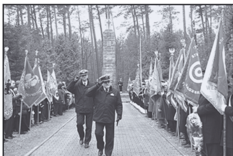
Hołd pomordowanym, jak co roku, oddają żołnierze Marynarki Wojennej