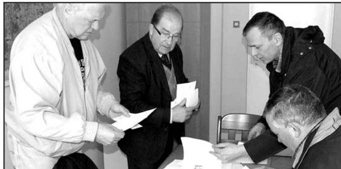
Formularze po segregacji zostały dokładnie przeliczone.