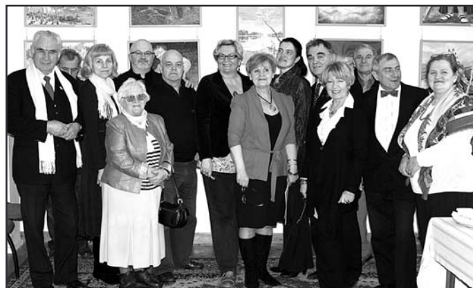
Autorzy prac na wernisażu w Gdyni