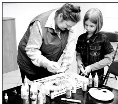
Sztuka malowania na szkle wymaga sporej cierpliwości