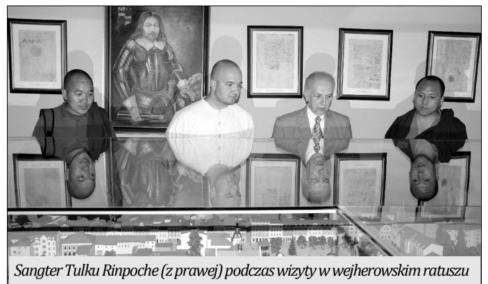
Sangter Tulku Rinpoche (z prawej) podczas wizyty w wejherowskim ratuszu

Rinpoche bardzo chciałby zgromadzić fundusze na budowę szpitala dla wszystkich mieszkańców południowego Sikkimu w północnych Indiach. Większość tamtejszej ludności pozbawiona jest jakichkolwiek funduszy na leczenie,