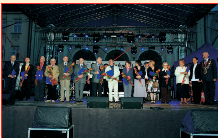
Laureaci Nagrody Prezydenta Miasta Wejherowa

Tegoroczne święto miasta wejherowianie uczcili organizacją wielu wydarzeń. W piątek na rynku przed ratuszem odbyła się parada młodzieży Zespołu Szkół Ponadgimnazjalnych nr 4 im. Jakuba Wejhera. Natomiast w sobotę miało miejsce różne imprezy, w tym Ogólnopolskie Biegi Przełajowe w Parku Miejskim, Turniej Strzelecki o Miecz Jakuba Wejhera, Festiwal Piosenki Harcerskiej i Szantowej „Mielizna” w Bazie Harcerskiej Cedron oraz zakończenie Turnieju Skata Sportowego o Puchar Prezy-