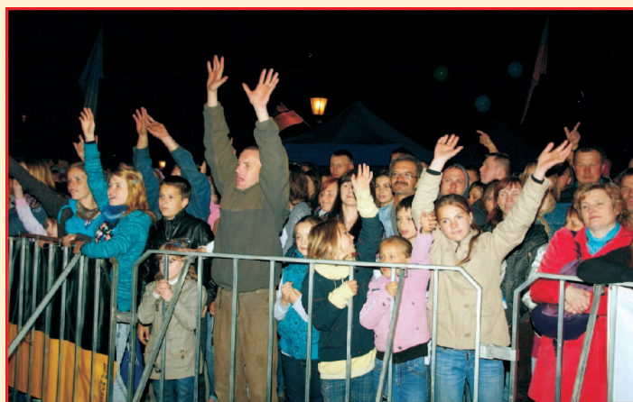
Publiczność podczas koncertu bawiła się doskonale

Tegoroczne święto miasta wejherowianie uczcili organizacją wielu wydarzeń. W piątek na rynku przed ratuszem odbyła się parada młodzieży Zespołu Szkół Ponadgimnazjalnych nr 4 im. Jakuba Wejhera. Natomiast w sobotę miało miejsce różne imprezy, w tym Ogólnopolskie Biegi Przełajowe w Parku Miejskim, Turniej Strzelecki o Miecz Jakuba Wejhera, Festiwal Piosenki Harcerskiej i Szantowej „Mielizna” w Bazie Harcerskiej Cedron oraz zakończenie Turnieju Skata Sportowego o Puchar Prezy-