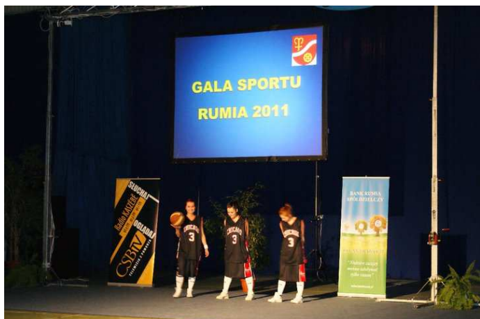
Swoje umiejętności zaprezentowała także grupa taneczna „Dirty Getto Kids”