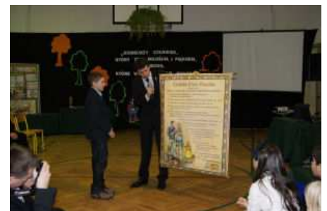
Wręczenie dzieciom „Kodeksu Praw Dziecka”