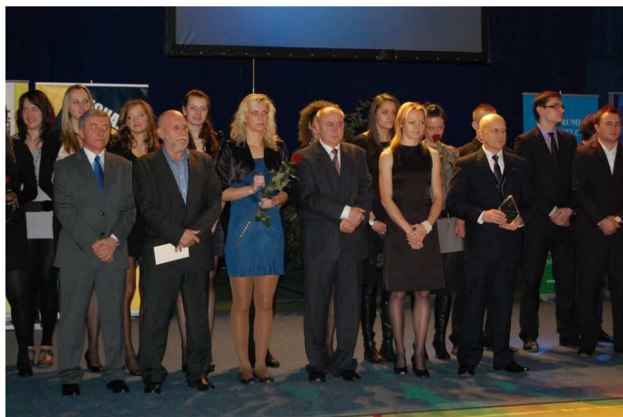
Na XVII Gali Sportu wręczono nagrody i wyróżnienia

Podczas Gali zaprezentowały się także rumskie kluby sportowe, które pochwały się swoimi osiągnięciami i sukcesami. Uroczystość uświetniły występy artystyczne Zespołu Tanecznego "Spinki".