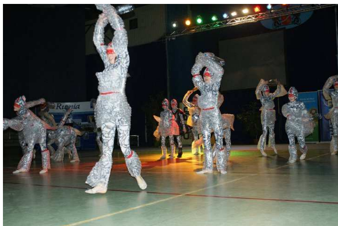
Podczas imprezy wystąpiły dziewczęta z Zespołu Tanecznego SPINKI