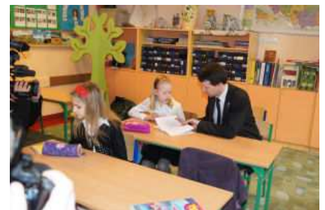
Wizyta w klasie