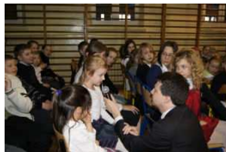
Rozmowa z dziećmi