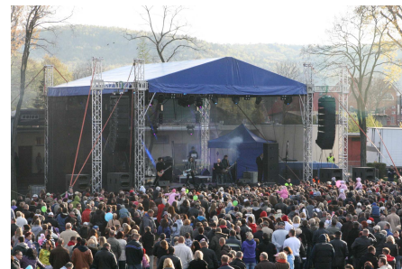
Występ Gwiazdy Wieczoru, którą był Stachurski zgromadził tłumy fanów