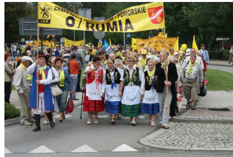
Rumscy Kaszubi na ulicach Lęborka