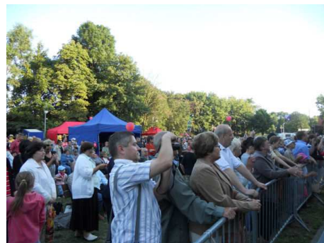
Irena Jarocka ma wciąż licznych fanów

„Letnia Biesiada” była imprezą plenerową dla całych rodzin, a odbyła się na scenie letniej przy Dworku pod Lipami w parku przy Starowiejskiej. Zabawa zaczęła się o godz. 16, zakończyła około godz. 22. Do dyspozycji uczestników były punkty małej gastronomii, piwo beczkowe, plac zabaw, stoiska handlowe, wata cukrowa, popcorn, balony, cukierki, gofry, catering i ciepłe posiłki. Nie zabrakło także nagród dla uczestników licznych konkursów, do udziału w których zapraszał konferansjer. Natomiast do tańca namawiały przez cały wieczór dwa zespoły: „Szwagry” i „Składak”. Gościem i Gwiazdą Wieczoru była Irena Jarocka, której występ zgromadził licznych wielbicieli. Kapryśna ostatnio pogoda również dopisała, więc wszyscy uczestnicy bawili się naprawdę dobrze.