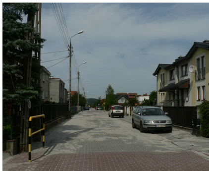
Ulica Chrobrego Ulica Świętopełka

W okolicach cmentarza komunalnego przy Górnicej, nowa nawierzchnia i chodniki z kostki betonowej, zyskały ulice: Hutnicza i Tkacka.