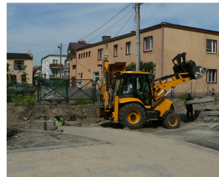
Ulica Lipowa Skrzyżowanie ulic: Tkackiej i Hutniczej